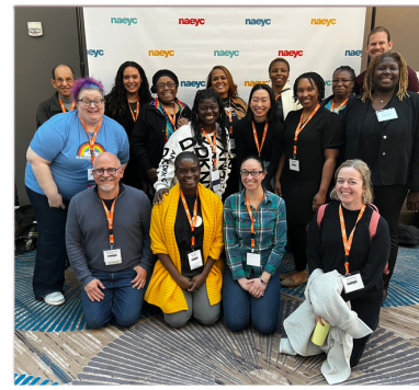
DCAEYC en el Foro de Políticas Públicas de NAEYC 2023

¡Conozca a más de nuestros miembros! Encuentre este y más Miembros Destacados en dcaeyc.org/member-spotlight .